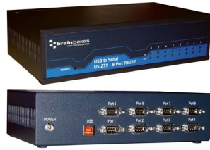
USB - Soros - Ipari