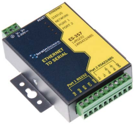
Ethernet - Soros