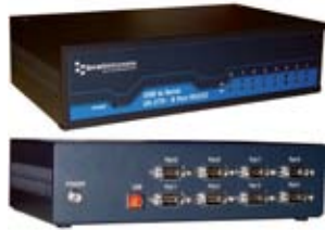
USB dla przemysłowych urządzeń szeregowych