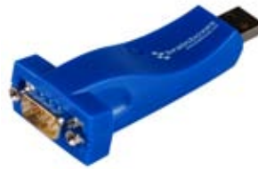
USB dla komputerów stacjonarnych