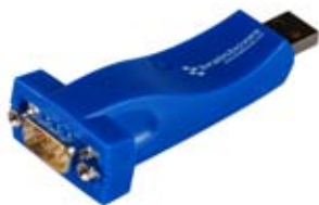
USB - Soros - Asztali